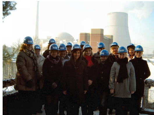
Die GNS Gesellschaft für Nuklear-Service mbH hatte diese Exkursion für ihre WiN-Mitglieder und WiN-Interessierte angeregt.

Unter dem Motto "WiNners besuchen KKW Emsland" reisten 15 Mitarbeiterinnen der GNS Gesellschaft für Nuklear-Service mbH aus Essen und Gorleben am 26. Januar 2010 zum RWE-Standort nach Lingen.